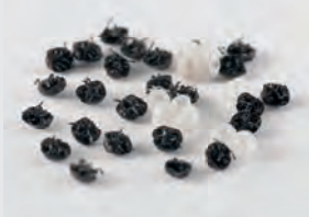
Baumwanzen-Eier / Nymphen